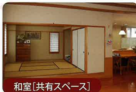
和室[共有スペース]